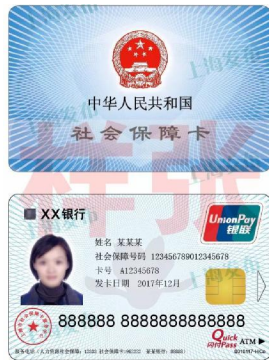
上海新版社保卡样张